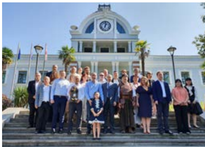
Saldus novada pašvaldības delegācija un Nīgrandes pagasta kapela “Spēlmaņi” Tskaltubo

Uz svētkiem koncertēt tika aicināta mūsu novada kapela “Spēlmaņi”, kuri priecēja pilsētas iedzīvotājus un viesus ar brīnišķīgiem koncertiem. Katra uzstāšanās beidzās ar vētraiņiem aplausiem un lielām ovācijām. Sakām