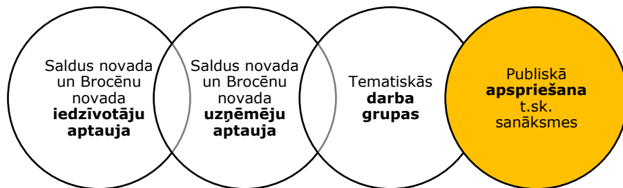
Attēls 2: Attīstības programmas izstrādes procesa galvenie sabiedrības līdzdalības iesaistes elementi

Laika posmā no 2021. gada 20.jūlija līdz 2.augustam tika organizētas attīstības programmas izstrādes tematiskās darba grupu sanāksmes 4 , kurās piedalījās gan iedzīvotāji, gan uzņēmēji, gan pašvaldības dažādu jomu speciālisti.